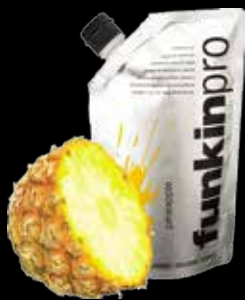
Pineapple - 100% ананас