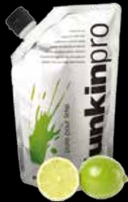
Pure pour lime - 100% лайм