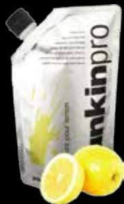
Pure pour lemon - 100% лимон