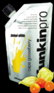
CAPE GOOSEBERRY - 90% физалис - 10% сахар