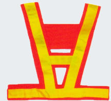
#04 V-образный жилет Материал: Утолщенная сетчатая ткань