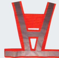
#32 V-образный жилет Материал: Утолщенная сетчатая ткань