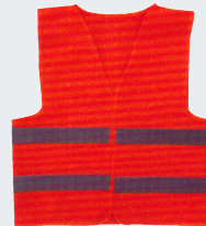
#03 Хлопчатобумажный жилет Материал: основовязанный трикотаж