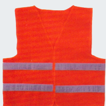
#21 Хлопчатобумажный жилет Материал: основовязанный трикотаж