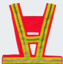
#25 V-образный жилет Материал: Утолщенная сетчатая ткань