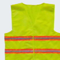
#24 Хлопчатобумажный жилет Материал: основовязанный трикотаж