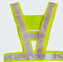
#07 V-образный жилет Материал: Утолщенная сетчатая ткань