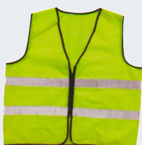
#22 Хлопчатобумажный жилет Материал: основовязанный трикотаж