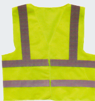
#13 Хлопчатобумажный жилет Материал: основовязанный трикотаж