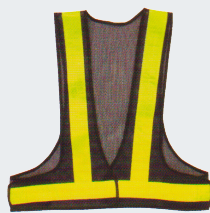
#10 V-образный жилет Материал: Утолщенная сетчатая ткань