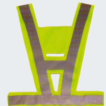
#08 V-образный жилет Материал: Утолщенная сетчатая ткань