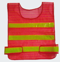
#16 Сетчатый жилет Материал: Утолщенная сетчатая ткань