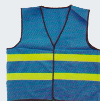
#28 Хлопчатобумажный жилет Материал: основовязанный трикотаж