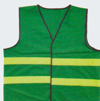
#23 Хлопчатобумажный жилет Материал: основовязанный трикотаж