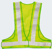
#05 V-образный жилет Материал: Утолщенная сетчатая ткань