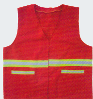
#17 Хлопчатобумажный жилет Материал: основовязанный трикотаж