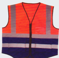
#18 Хлопчатобумажный жилет Материал: основовязанный трикотаж