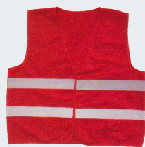
#27 Хлопчатобумажный жилет Материал: основовязанный трикотаж