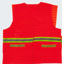
#14 Сетчатый жилет Материал: Утолщенная сетчатая ткань