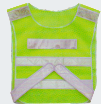
#12 Сетчатый жилет Материал: Утолщенная сетчатая ткань