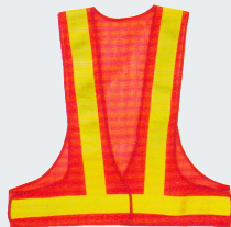
#06 V-образный жилет Материал: Утолщенная сетчатая ткань