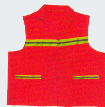
#20 Хлопчатобумажный жилет Материал: основовязанный трикотаж