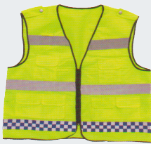
#30 Хлопчатобумажный жилет Материал: основовязанный трикотаж