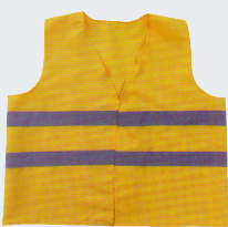
#29 Хлопчатобумажный жилет Материал: основовязанный трикотаж