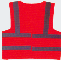
#02 Хлопчатобумажный жилет Материал: основовязанный трикотаж