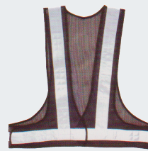
#11 V-образный жилет Материал: Утолщенная сетчатая ткань