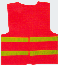
#09 Хлопчатобумажный жилет Материал: основовязанный трикотаж