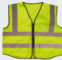
#31 Хлопчатобумажный жилет Материал: основовязанный трикотаж