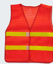
#15 Сетчатый жилет Материал: Утолщенная сетчатая ткань