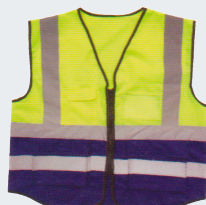
#19 Хлопчатобумажный жилет Материал: основовязанный трикотаж