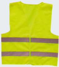
#01 Хлопчатобумажный жилет Материал: основовязанный трикотаж