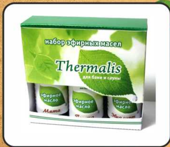
Набор №1 Мята, Эвкалипт, Пихта