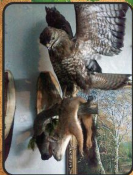
Ястреб и белка