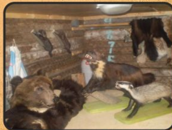
Медведь и барсук