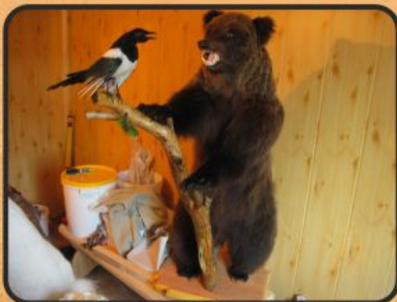
Медведь с сорокой