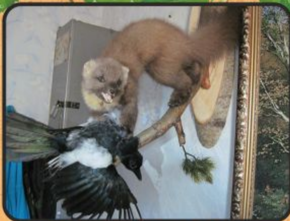
Куница с сорокой