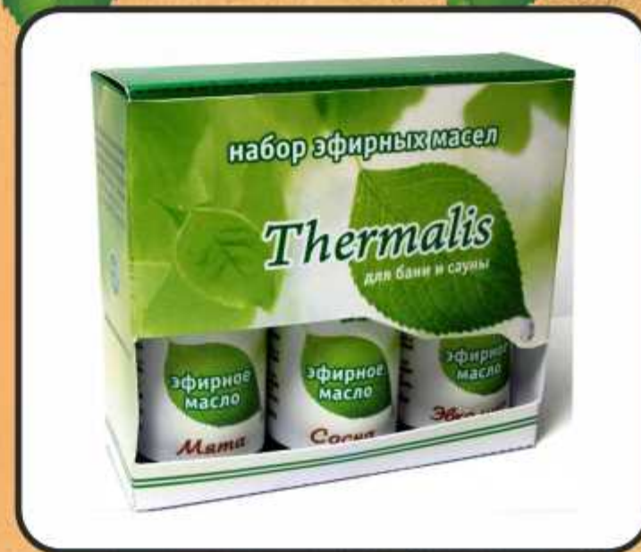
Набор №2 Мята, Эвкалипт, Сосна