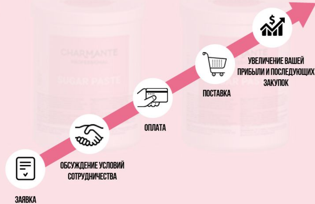
СХЕМА РАБОТЫ С НАМИ