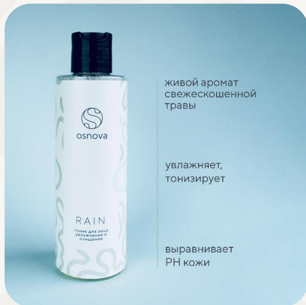
Тоник. Osnova Rain. 200 мл.