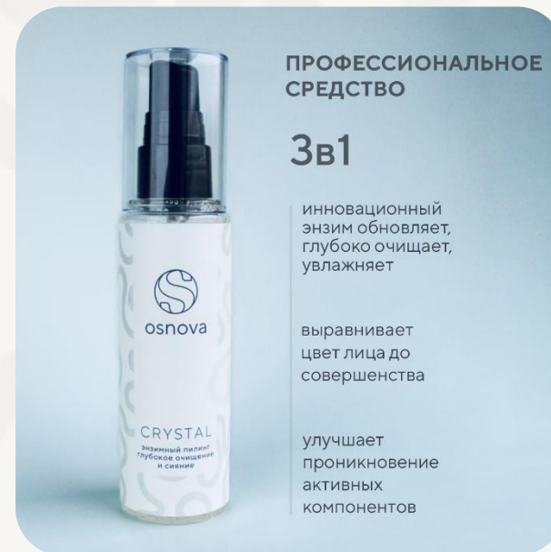
Энзимный пилинг. Osnova Crystal. 75 мл.