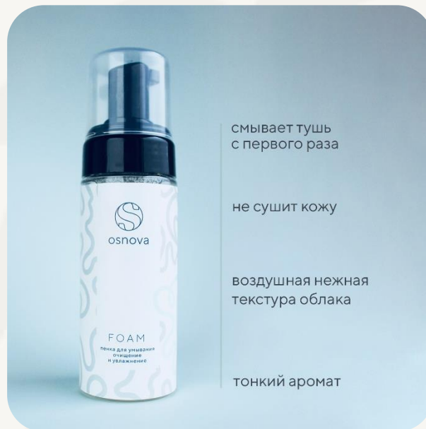
Пенка для умывания. Osnova Foam. 150 мл.