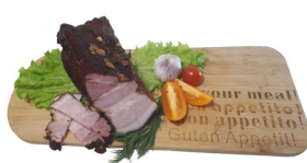
Грудка "Фермерская" (по домашнему) ТУ 10.13.14.-004-20855790-2017 Масса: 1,5 кг. Срок годности: 30 суток. Состав: свинина, посолочная смесь.