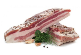
Грудка Соленая Масса: 1 - 1,5 кг. Срок годности: 30 суток. Состав: грудка свиная, соль, чеснок, лавровый лист, перец черный горошек.