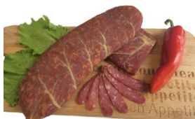
Колбаса «Гродненский Гостинец» Масса: 0,6 кг. Срок годности: 90 суток. Состав: Свинина, посолочная смесь, специи.