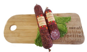
Колбаса с/к "Миланская" ТУ 10.13.14.-015-20855790-2020 Масса: 0,5 кг. Срок годности: 150 суток. Состав: свинина, посолочная смесь, стартовая культура.