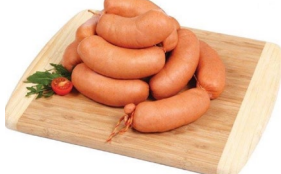
Сардельки "Фермерские" ТУ 10.13.14-006-20855790-2017 Масса: 1 кг. Срок годности: 30 суток Состав: свинина, куриное филе, шпик, посолочная смесь.