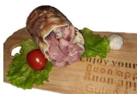
Сальтисон "Медвежье ушко" ТУ 10.13.14.-011-20855790-2017 Масса: 0,8 кг. Срок годности: 20 суток. Состав: язык свиной, уши свиные, бульон, желатин, вода, посолочная смесь.