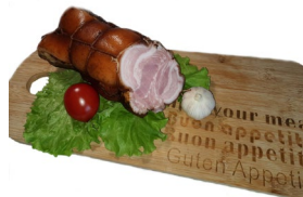
Рулет в/к "Фермерский" ТУ 10.13.14.-004-20855790-2017 Масса: 1,5 кг. Срок годности: 30 суток. Состав: свинина, посолочная смесь.