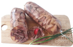
Мозаика в желе "Язык свиной в желе" ТУ 10.13.14.-008-20855790-2017 Масса: 1,2 кг. Срок годности: 30 суток. Состав: язык свиной, желатин, вода, посолочная смесь.