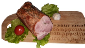
Рулет в/к "Мраморный" ТУ 10.13.14.-004-20855790-2017 Масса: 1,5 кг. Срок годности: 30 суток Состав: свинина, посолочная смесь.