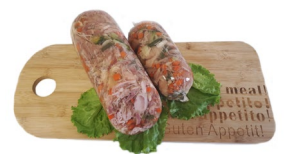
Мозаика в желе "Индейка с овощами" ТУ 10.13.14.-007-20855790-2017 Масса: 0,5 и 1,2 кг. Срок годности: 30 суток. Состав: мясо куриное, морковь, цветная капуста, фасоль, желатин, вода, посолочная смесь.