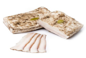
Шпик соленый с черным перцем Масса: 0,6 кг. Срок годности: 30 суток. Состав: шпик свиной, соль, чеснок, черный перец молотый.