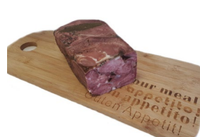
Заливное "Язык прессованный" ТУ 10.13.14.-008-20855790-2017 Масса: 0,8 кг. Срок годности: 20 суток. Состав: язык свиной, желатин, вода, посолочная смесь.