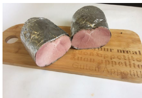
Окорок «Фермерский» ТУ 10.13.14.-004-20855790-2017 Состав: свинина, соль, посолочная смесь, черный перец молотый