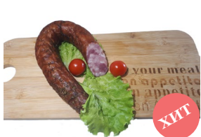
Колбаса п/к "Домашка говьязя" ТУ 10.13.14.-012-20855790-2019 Масса: 1,5 кг. Срок годности: 30 суток. Состав: говядина, свинина, мясо птицы, шпик, посолочная смесь.