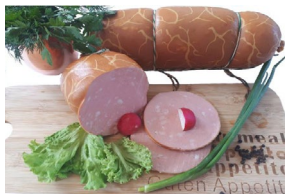
Колбаса "Мортаделла" (натурин) ТУ 10.13.14-009-20855790 Масса: 2 кг. Срок годности: 30 суток Состав: свинина, куриное филе, пик, вода, посолочная смесь.