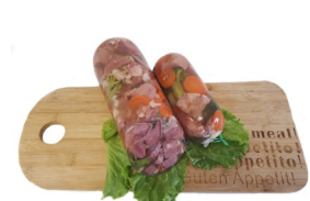
Мозаика в желе "Заливное язык с овощами" ТУ 10.13.14.-008-20855790-2017 Масса: 0,5 и 1,2 кг. Срок годности: 30 суток. Состав: язык свиной, морковь, цветная капуста, желатин, вода, посолочная смесь.