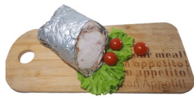
Галантин "Любительский" к/в ТУ 10.13.14.-003-20855790-2017 Масса: 1 кг. Срок годности: 20 суток. Состав: филе грудок куриное, посолочная смесь.