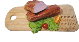
Карбонад в/к "Столичный" ТУ 10.13.14.-004-20855790-2017 Масса: 1,5 кг. Срок годности: 30 суток. Состав: свинина, посолочная смесь.