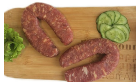
Колбаса «от бабушки» с/в Масса: 0,8 кг. Срок годности: 90 суток Состав: свинина, посолочная смесь, специи.