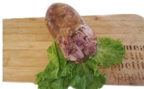
Мозаика в желе "Цесарочка княжеская" ТУ 10.13.14.-007-20855790-2017 Масса: 1,2 кг. Срок годности: 30 суток. Состав: мясо куриное, морковь, цветная капуста, фасоль, желатин, вода, посолочная смесь.