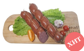
Сервелат в/к "Ореховый люкс" ТУ 10.13.14-012-20855790-2019 Масса: 0,5 кг. Срок годности: 30 суток Состав: свинина, говядина, мясо птицы, шпик, посолочная смесь.