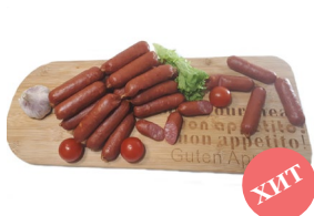
Колбаски п/к "Баварские с сыром" ТУ 10.13.14.-049-37676459-2016 Масса: 1 кг. Срок годности: 30 суток. Состав: свинина, куриное мясо, шпик, сыр, посолочная смесь.