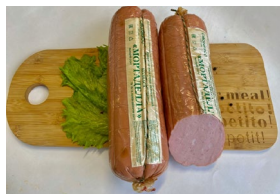
Колбаса "Мортаделла" (целлофан) Масса: 1,2 кг. Срок годности: 30 суток Состав: филе птицы, шпик, яйцо куриное, посолочная смесь.