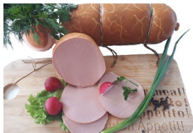
Колбаса "Докторская" (натурин) ГОСТ 23670-2019 Масса: 2 кг. Срок годности: 30 суток Состав: свинина, говядина, вода, молоко, яйцо куриное, посолочная смесь.