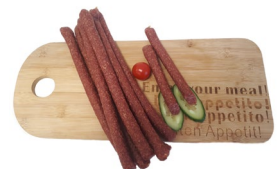
Колбаски с/к "Прованс" ТУ 10.13.14.-048-37676459-2017 Масса: 0,5 кг. Срок годности: 120 суток. Состав: свинина, шпик, говядина, посолочная смесь, стартовая культура.