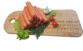
Сосиски "Молочные" ГОСТ 23670-2019 Масса: 1 кг. Срок годности: 30 суток Состав: свинина, говядина, вода, молоко, яйцо куриное, посолочная смесь.