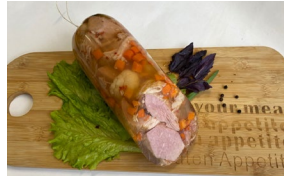
Заливное Свинина с паприкой Масса: 1 кг. Срок годности: 30 суток. Состав: свинина, брокколи, вода, желатин, посолочная смесь.