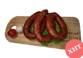
Колбаса п/к "Краковская" ГОСТ 31758-2012 Масса: 1 кг. Срок годности: 30 суток. Состав: свинина, говядина, грудка свинья, посолочная смесь.