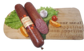
Колбаса в/к "Сервелат" ГОСТ Р 55455-2013 Масса: 0,5 кг. Срок годности: 30 суток Состав: грудка, говядина, свинина, посолочная смесь.