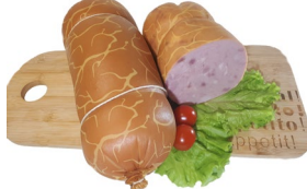
Ветчина "Фермерская классическая" ТУ 10.13.14-006-20855790-2017 Масса: 3 кг. Срок годности: 30 суток Состав: свинина, филе куриной грудки, посолочная смесь.