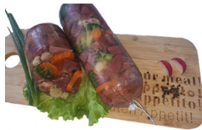
Мозаика в желе "Заливное из говядины" ТУ 10.13.14.-008-20855790-2017 Масса: 1,2 кг. Срок годности: 30 суток. Состав: мясо говядины, морковь, цветная капуста, желатин, вода, посолочная смесь.