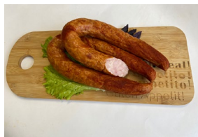
Колбаса «Домашка из птицы» Масса 0,5 кг. Срок годности: 45 суток. Состав: филе птицы, шпик боковой, посолочная смесь, специи.