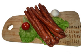
Колбаски в/к "Австрийские" ТУ 10.13.14.-049-37676459-2016 Масса: 1 кг. Срок годности: 30 суток. Состав: свинина, куриное мясо, шпик, посолочная смесь.