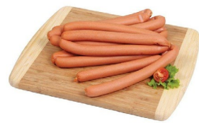
Сосиски "Нежные" ТУ 10.13.14-009-20855790-2017 Масса: 1 кг. Срок годности: 20 суток Состав: мясо птицы, вода, молоко сухое, посолочная смесь.