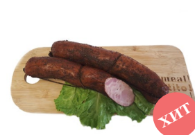
Чимган Масса: 0,6 кг. Срок годности: 30 суток. Состав: свинина, говядина, грудка свинья, посолочная смесь, чеснок.