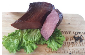
Говядина в/к "Элитная" ТУ 10.13.14.-004-20855790-2017 Масса: 1,5 кг. Срок годности: 30 суток. Состав: говядина, посолочная смесь.