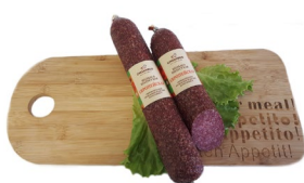
Европейская с/к Масса: 0,6 кг. Срок годности: 150 суток. Состав: свинина, шпик, филе кур, посолочная смесь, перец черный.