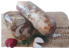
Мозаика в желе "Крольчатата" ТУ 10.13.14.-007-20855790-2017 Масса: 0,5 и 1,2 кг. Срок годности: 30 суток. Состав: мясо куриное, желатин, морковь, вода, посолочная смесь.