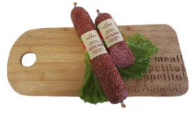
Колбаса с/к "Анталья" ТУ 10.13.14.-015-20855790-2020 Масса: 0,5 кг. Срок годности: 150 суток. Состав: свинина, посолочная смесь, стартовая культура.