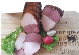
Рулет в/к "Дузт" ТУ 10.13.14.-004-20855790-2017 Масса: 1,5 кг. Срок годности: 30 суток. Состав: свинина, говядина, посолочная смесь.