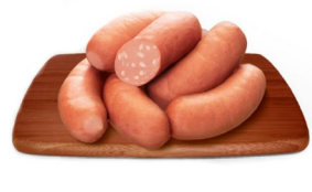
Шпикачки "Москворецкие" ГОСТ 23670-2019 Масса: 1 кг. Срок годности: 30 суток Состав: говядина, свинина, шпик, посолочная смесь.