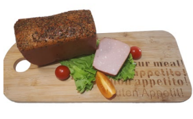
Хлеб "Мясной" ТУ 10.13.14-009-20855790-2017 Масса: 1 кг. Срок годности: 20 суток Состав: филе куриной грудки, свинина, шпик, посолочная смесь.