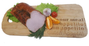
Рулет в/к "Царское угощение" ТУ 10.13.14.-004-20855790-2017 Масса: 1,5 кг. Срок годности: 30 суток. Состав: свинина, посолочная смесь.