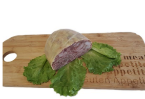
Сальтисон "По домашнему" ТУ 10.13.14.-011-20855790-2017 Масса: 0,8 кг. Срок годности: 20 суток. Состав: мясо свиных голов, свиных ног, язык свиной, бульон, желатин, вода, посолочная смесь.