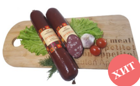
Колбаса в/к "Московская" ГОСТ Р 55455-2013 Масса: 0,5 кг. Срок годности: 30 суток Состав: говядина, шпик, посолочная смесь.