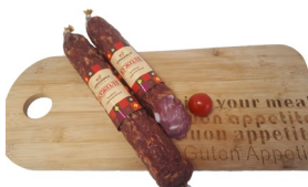
Колбаса с/к "Бужолок" ТУ 10.13.14.-015-20855790-2020 Масса: 0,5 кг. Срок годности: 150 суток. Состав: свинина, посолочная смесь, стартовая культура.