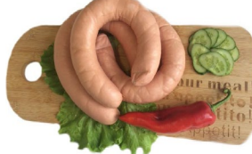
Колбаса "Аппетитная" ТУ 10.13.14-006-20855790-2017 Масса: 1 кг. Срок годности: 20 суток Состав: куриное филе, говядина, шпик, посолочная смесь.