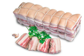
Руллет "Фермерский" соленый Масса: 1,5 кг. Срок годности: 30 суток. Состав: грудка свиная, соль, чеснок, лавровый лист, паприка, перец черный горошек.