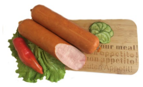
Ветчина "Аппетитная" ТУ 10.13.14-006-20855790-2017 Масса: 1 кг. Срок годности: 30 суток Состав: свинина, вода, посолочная смесь.