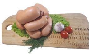
Сардельки "Свинные" ГОСТ 23670-2019 Масса: 1 кг. Срок годности: 30 суток Состав: говядина, свинина, посолочная смесь.