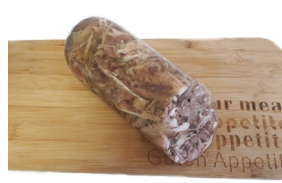
Мозаика в желе "Куриная с травами" ТУ 10.13.14.-007-20855790-2017 Масса: 1,2 кг. Срок годности: 30 суток. Состав: мясо куриное, желатин, вода, укроп сушеный, посолочная смесь.