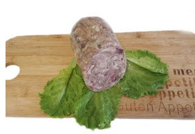
Зельц "Деревенский" ТУ 10.13.14.-011-20855790-2017 Масса: 0,8 кг. Срок годности: 20 суток. Состав: мясо свиных голов, уши свиные, бульон, желатин, вода, посолочная смесь.