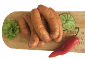
Колбаски "Шаньлычные" Масса 0,5 кг. Срок годности: 30 суток. Состав: филе птицы, шеквина, посолочная смесь, специи.