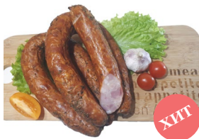
Колбаса п/к "Домашка свинья" ТУ 10.13.14.-012-20855790-2019 Масса: 1,5 кг. Срок годности: 30 суток. Состав: свинина, мясо птицы, шпик, посолочная смесь.