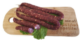
Колбаса с/в "От бабушки" ТУ 10.13.14.-015-20855790-2020 Масса: 0,5 кг. Срок годности: 120 суток. Состав: свинина, шпик, посолочная смесь, тмин.