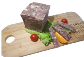
Холодец "Фермерский" (пресованное мясо свиных голов) ТУ 10.13.14.-008-20855790-2017 Масса: 0,8 кг. Срок годности: 20 суток. Состав: мясо свиных голов, свиных ног, бульон, желатин, вода, посолочная смесь.