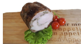
Галантин "Аппетитный" к/в ТУ 10.13.14.-003-20855790-2017 Масса: 1 кг. Срок годности: 20 суток. Состав: филе грудок куриное, посолочная смесь.