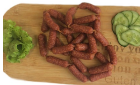
Смольяски «Чили» с/к Масса: 0,25 кг. Срок годности: 120 сут. Состав: свинина, посолочная смесь, паприка, чеснок, перец чили.