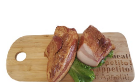
Шековина в/к "Фермерская" ТУ 10.13.14.-004-20855790-2017 Масса: 1 кг. Срок годности: 30 суток. Состав: свинина, посолочная смесь.