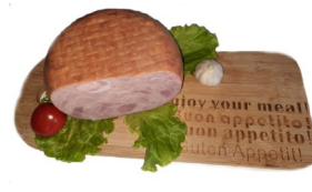
Ветчина "По домашнему" ТУ 10.13.14-006-20855790-2017 Масса: 2 кг. Срок годности: 30 суток Состав: свинина, филе куриной грудки, посолочная смесь.