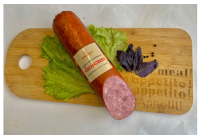
Колбаса «Бальковая» п/к Масса 1 кг. Срок годности: 25 суток. Состав: свинина, филе птицы, шпик, посолочная смесь, специи.