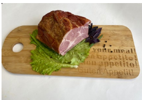
Шейка свинная «Фермерская» ТУ 10.13.14.-004-20855790-2017 Состав: свинина, соль, посолочная смесь