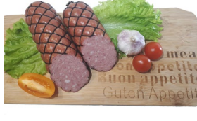
Сервелат в/к "Рублевский люкс" ТУ 10.13.14-012-20855790-2019 Масса: 0,5 кг. Срок годности: 30 суток Состав: свинина, мясо птицы, говядина, шпик, посолочная смесь.