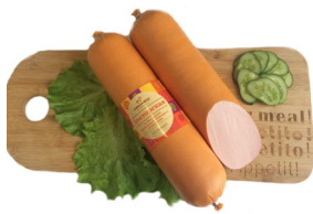
Колбаса "Докторская" (белкозин) ГОСТ 23670-2019 Масса: 1 кг. Срок годности: 30 суток Состав: свинина, говядина, вода, молоко, яйцо куриное, посолочная смесь.