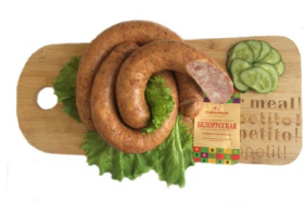
Колбаса «Белорусская» п/к Масса 0,5 кг. Срок годности: 30 суток. Состав: филе птицы, шпик, посолочная смесь, специи.