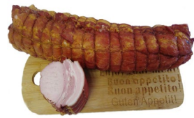
Корейка "Фермерская" ТУ 10.13.14.-004-20855790-2017 Масса: 2 кг. Срок годности: 30 суток. Состав: свинина, посолочная смесь.