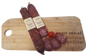
Колбаса с/в "Брестское угощение" ТУ 10.13.14.-015-20855790-2020 Масса: 0,5 кг. Срок годности: 150 суток. Состав: свинина, посолочная смесь, стартовая культура.