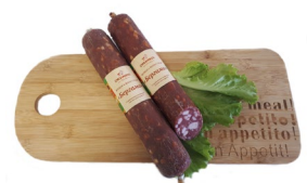
Колбаски с/к "Бергамо" ТУ 10.13.14.-015-20855790-2020 Масса: 0,5 кг. Срок годности: 120 суток. Состав: свинина, шпик, посолочная смесь.