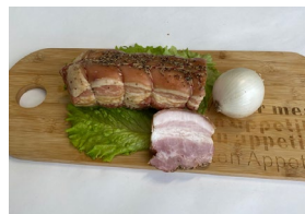
Грудка «Домашняя из печи» в/к Масса 0,6 кг. Срок годности: 30 суток. Состав: грудка свинная, соль, посолочная смесь, специи.