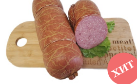
Миндальная Масса: 1 кг. Срок годности: 20 суток Состав: говядина, свинина, шпик, курица, посолочная смесь