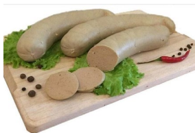
«Ливерная Фермерская сочная» Масса: 0,6 кг. Срок годности: 20 суток. Состав: щековина свиная, шкур свиная, крахмал, соль, бульон, посолочная смесь.