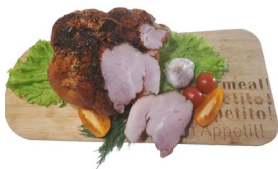
Свинина "Смачная" в/к ТУ 10.13.14.-004-20855790-2017 Масса: 1,5 кг. Срок годности: 30 суток Состав: свинина, посолочная смесь.