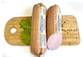
Колбаса "Филейная" Масса: 1 кг. Срок годности: 30 суток Состав: филе птицы, шеквина, яйцо куриное, посолочная смесь.