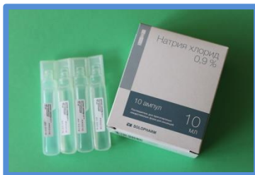
Физраствор/ Вода для инъекций