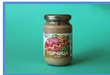
Продукт (напр.: Горчица)