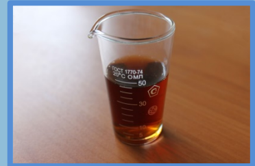
Продукт (напр.: Квас)