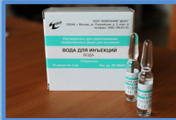
Вода для инъекций/ Физраствор